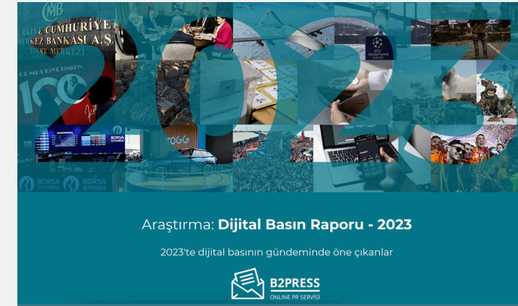
Dijital Basın Raporu - 2023