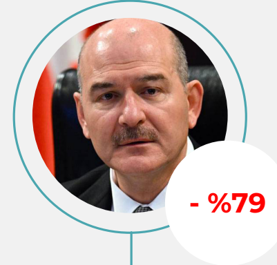
5. Süleyman Soylu Toplam Haber: 38.538