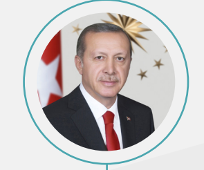
1. Recep Tayyip Erdoğan

Konu olduğu haberler 2023'e göre azalsa da Cumhurbaşkanı Recep Tayyip Erdoğan, yine listenin ilk sırasında yer aldı. Özgür Özel %238 artışla listeye ikinci sıradan girdi. Önceki yıl 6. sırada yer alan Ali Yerlikaya hakkındaki haberler 2,5 kattan fazla artarak onu 3.'lüğe taşıdı. Ekrem İmamoğlu %5 artışa rağmen 4.'lüğe gerilerken, geçen yılın listesine son sıradan giren Mehmet Şimşek ikiye katlanan haberleriyle 5. oldu.