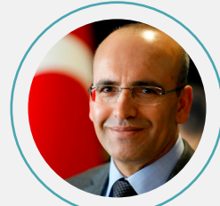
5. Mehmet Şimşek