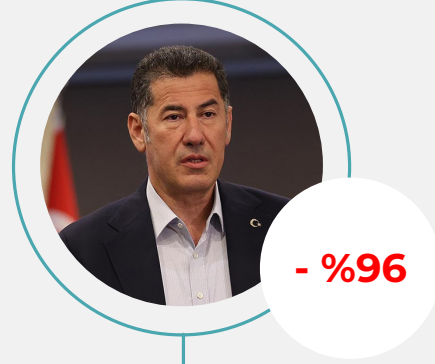
1. Sinan Oğan Toplam Haber: 6.308