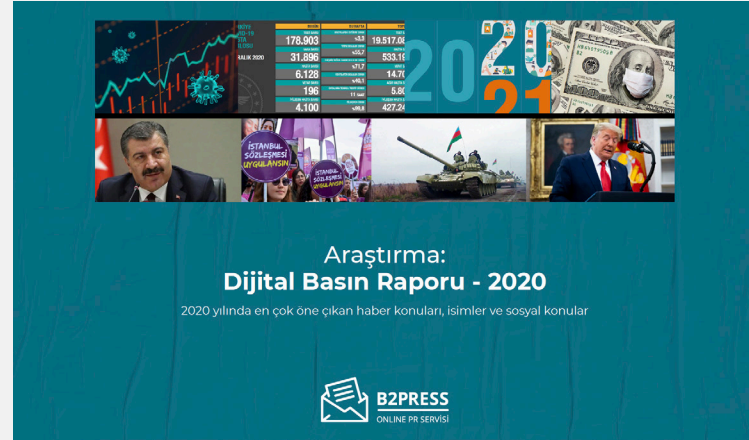
Dijital Basın Raporu - 2020

Bizimle birlikte, 2020, 2021, 2022 ve 2023 yıllarına ait Dijital Basın Raporlarımızla yolculuğa çıkarak dijital basındaki değişimi keşfedin.