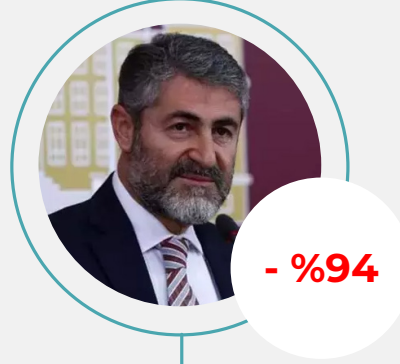
2. Nureddin Nebati Toplam Haber: 4.109