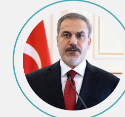
8. Hakan Fidan