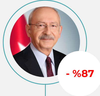
4. Kemal Kılıçdaroğlu Toplam Haber: 110.504