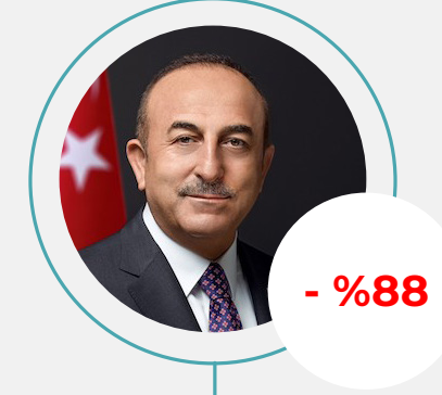
3. Mevlüt Çavuşoğlu Toplam Haber: 11.527