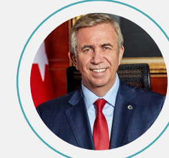
9. Mansur Yavaş