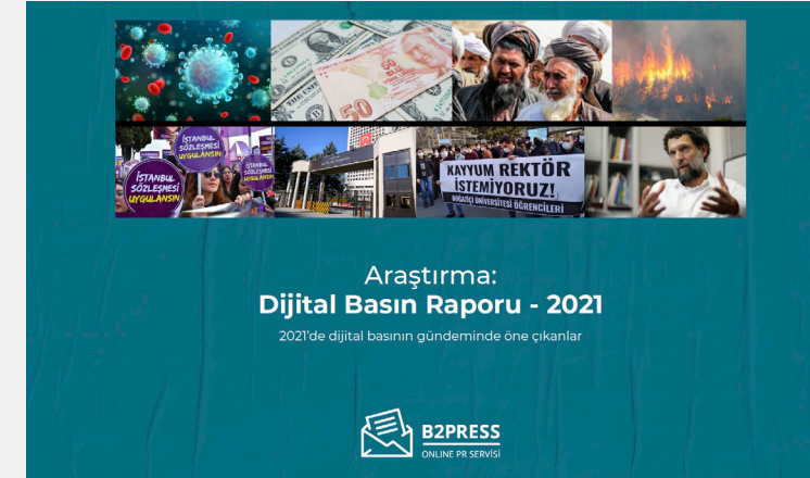
Dijital Basın Raporu - 2021