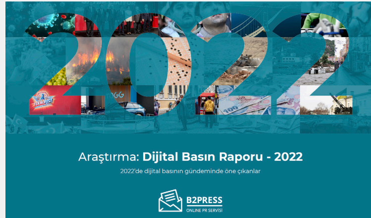
Dijital Basın Raporu - 2022