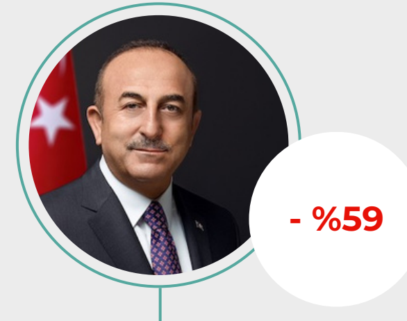
2. Mevlüt Çavuşoğlu