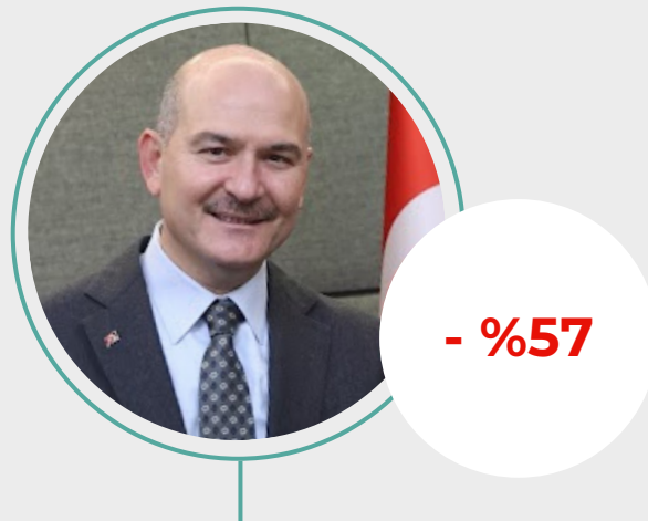
3. Süleyman Soylu