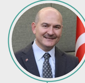
9. Süleyman Soylu