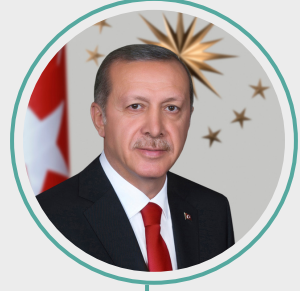
1. Recep Tayyip Erdoğan

Konu olduğu haberler 2022'ye göre %1 artan Cumhurbaşkanı Recep Tayyip Erdoğan, yine listenin ilk sırasında yer aldı. Kemal Kılıçdaroğlu, %42 artışla ikinci sıradaki yerini korurken, İBB Başkanı Ekrem İmamoğlu %13 artışla üçüncülüğe yükseldi. Bu yıl en çok haber olan Türk siyasetçiler listesinde ilk 10'a yeni girenler ise Devlet Bahçeli, Ali Yerlikaya, Mansur Yavaş ve Mehmet Şimşek oldu.