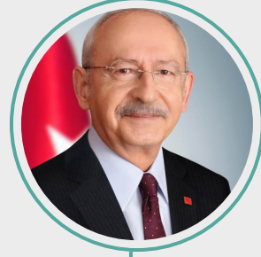
2. Kemal Kılıçdaroğlu