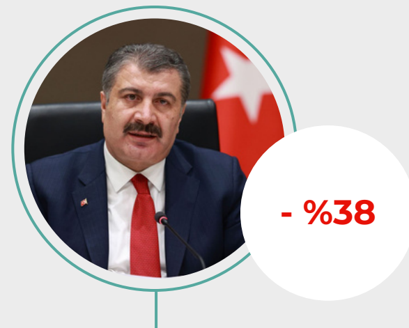
4. Fahrettin Koca