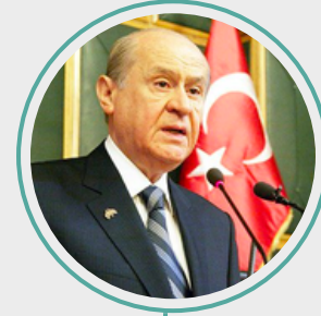
5. Devlet Bahçeli