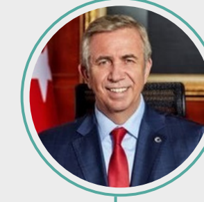
8. Mansur Yavaş