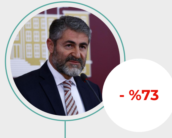
1. Nureddin Nebati

2023 yılında dijital medyada en hızlı ilgi kaybına uğrayan siyasetçileri belirledik. Bir önceki yıla kıyasla haber sayılarında gözle görülür azalma yaşayan isimler şöyle sıralanıyor: