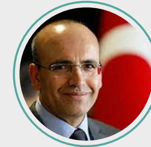
10. Mehmet Şimşek