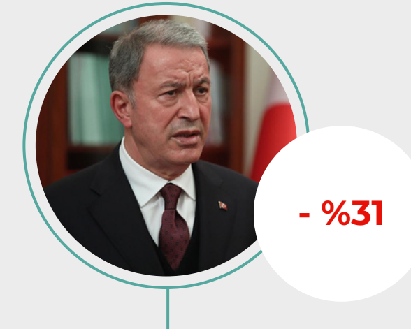
5. Hulusi Akar