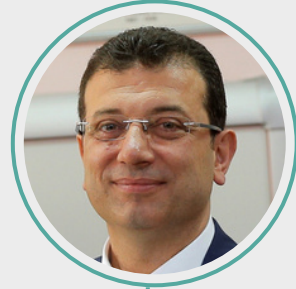
3. Ekrem İmamoğlu