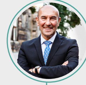
7. Tunç Soyer